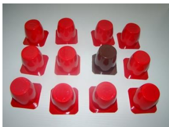
16 embalagens de Iogurte

Materiais diversos: arroz, feijão, clips, etc.